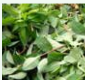
Scarti vegetali del giardinaggio: erba, rametti, foglie, fiori, rami