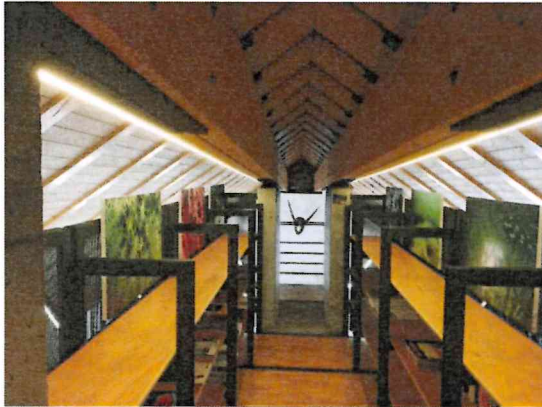
Biblioteca e laboratorio