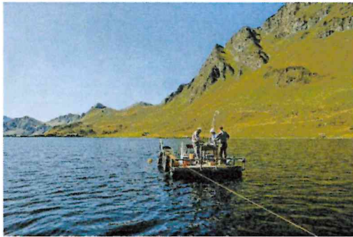
Centro Biologia Alpina (CBA)