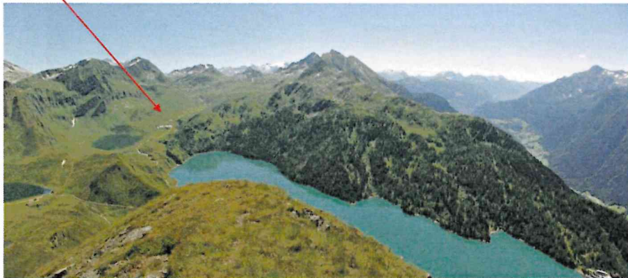
CBA localizzato in Val Piora con i laghi Ritom, Cadagno e Tom