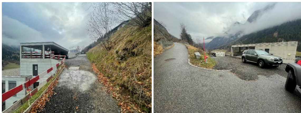
Situazione nell'autunno 2025